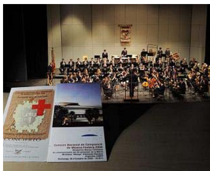
Imagen de ayer de un momento de la actuación de la banda sinfónica de la Sociedad Filarmonica Alteaense